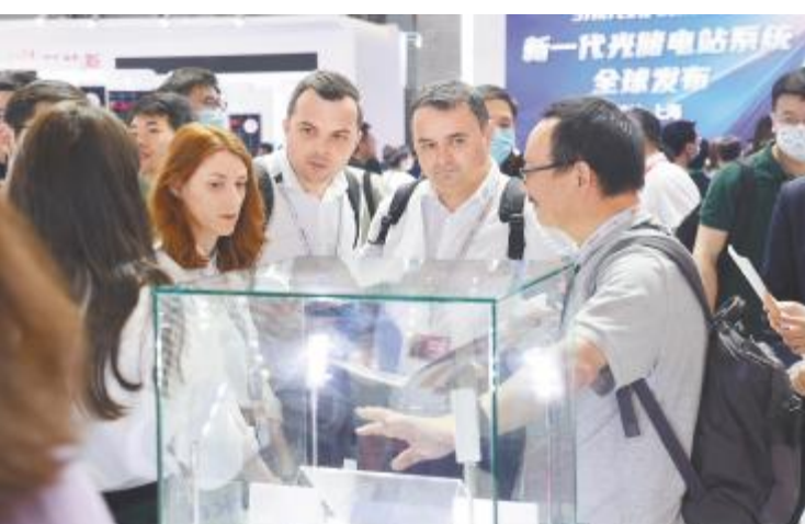
国内外观众详细了解通威太阳能电池片