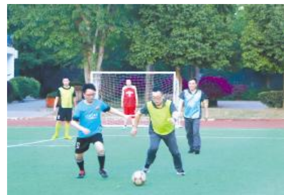
足球社团活动现场