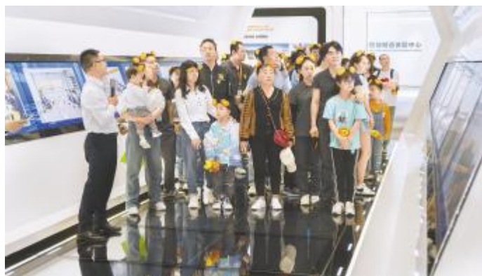
参观智能制造体验中心