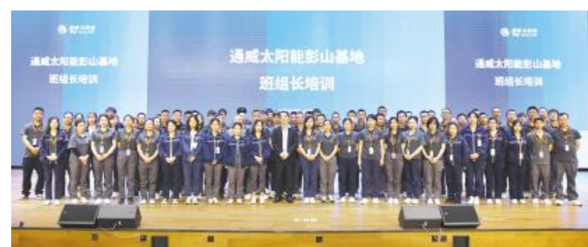
彭山基地班组长培训合影留念