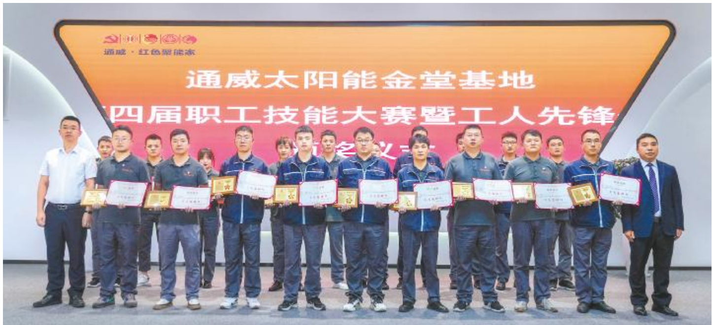
“工人先锋号”颁奖仪式现场