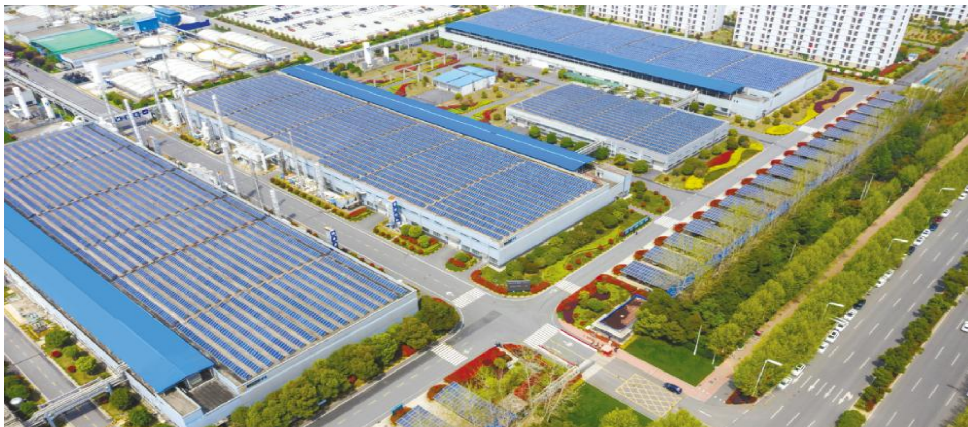
通威太阳能绿色工厂