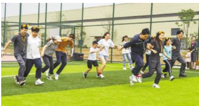
“基地之星”家庭同乐日亲子运动会