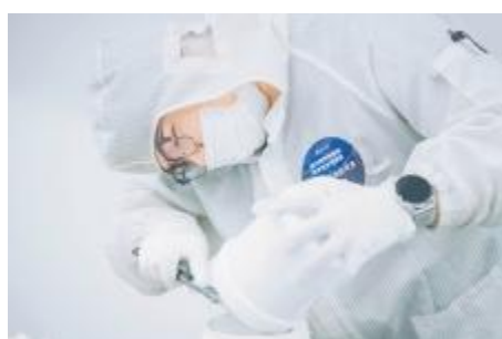
刮浆料桶技能竞赛