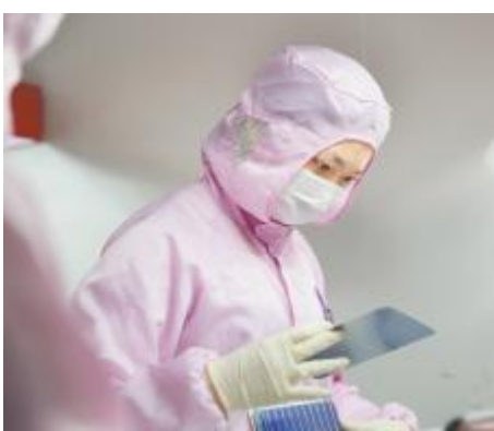
电池片检验技能竞赛