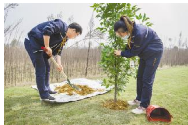
通威太阳能开展植树节活动