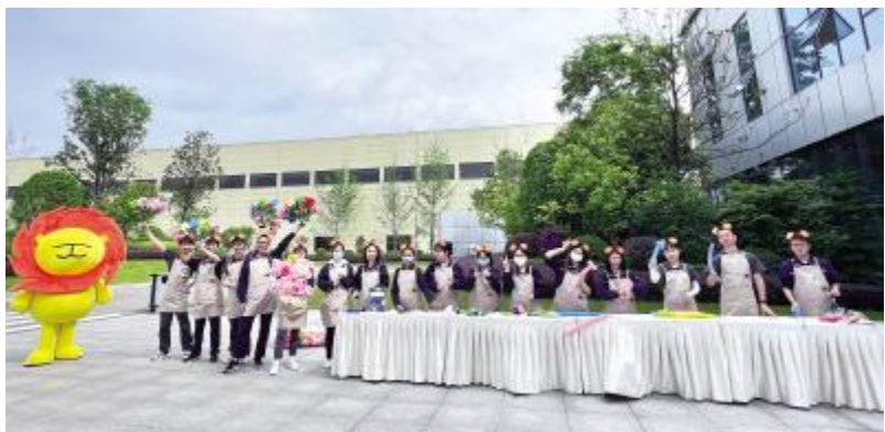
母亲节DIY气球花活动现场