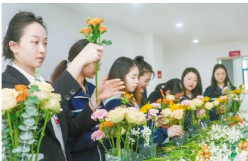
母亲节插花活动现场