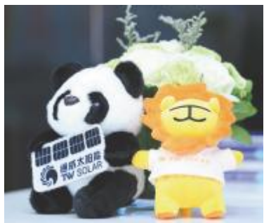
通威太阳能 IP 阳光仔出圈,成为展会上的宠儿

全球能源革命不断向纵深挺进,正谱写能源高质量发展新篇章。在全球能源转型大趋势下,光伏等可再生能源将是未来电力供应的主力军。从十年前的原料、市场、设备“三头在外”,到如今中国光伏制造业、光伏发电装机量、光伏发电量“三项世界第一”,中国光伏已成为比肩中国高铁的中国又一张亮丽名片。作为中国光伏企业代表,自2006年进军光伏行业以来,通威不断创新技术,持续夯实行业领先优势,已成为拥有