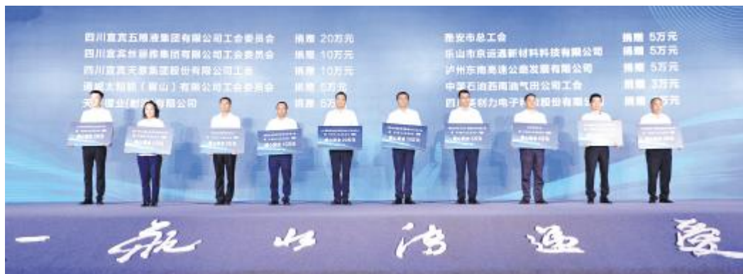
通威太阳能眉山基地工会积极参与“一瓶水传递爱”公益项目

通威太阳能眉山基地工会连续两年参与捐赠,始终心系一线职工,在上级工会和公司领导的支持下,主动作为,以“娘家人”的情怀竭诚服务广大职工。未来,通威太阳能将继续坚持关爱职工,把维护职工安全健康权益落在实处,切实为职工打造良好的工作环境,充分提升大家的凝聚力和战斗力,为公司高质高效发展作出积极贡献!