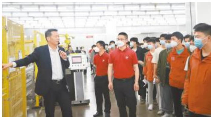
四川锅炉高级技工学校师生参观切片车间

人才是企业发展的基石。通威太阳能高度重视人才队伍培养,持续促进校企双方开展多层次、多形式的合作,不断创新校企双育人才培养模式。5月,通威太阳能与西南财经大学、西南石油大学、四川民族学院、四川锅炉高级技工学校等高校开展交流合作,探讨校企合作的可能性。