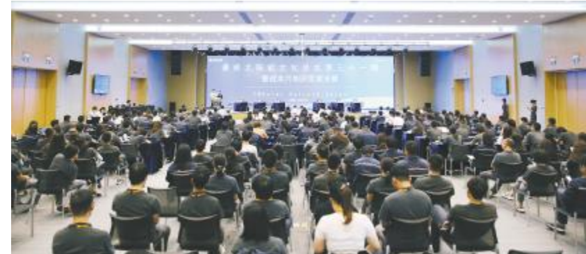
第三十一期文化沙龙暨本月知识竞赛决赛现场

“九层之台,起于累土。”班组建设是一个精修内功、长期系统的工作。本次培训作为新项目提高班组管理水平,加强班组建设的重要举措,旨在帮助班组长管理者深化管理认识,打破管理思维,为加强一线班组管理提供有力支撑。未来,人事行政部也将持续对班组建设保持高度关注,并通过创新开展班组建设各项活动,逐步建立以实践为载体、以经验为基础、以创新为动力、以强化为目的的长效班组建设机制,扎实提升标准化、制度化、规范化的班组管理质量,为项目蓬勃发展打下坚实基础,为公司高质量持续发展保驾护航!