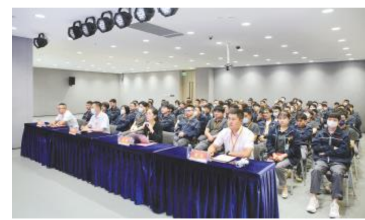
储备助理工程师2023年春季班开班仪式现场

活动的最后,厂务部相关负责人从长辈和用人部门的角度,发自肺腑与大家分享“珍惜与用心”两个关键词,鼓励大家珍惜所供的平台、人力资源的、导师的带教,3个月的学习周期,不仅仅是收获到知识和技能,让自己发现更多不足之处,将在未来继续钻研和学习,感谢公司提供的平台和导师尽责的带教,自己也会尽心尽力地工作。优秀导师代表根据自身经验,分享自己作为启航生,从入职到现在的成长经验和带教经验,作为学员要主动学习,有目标、善复盘、多提问、常总结,作为导师要高标准、严要求,让学员的思维和思想与自己保持同频。