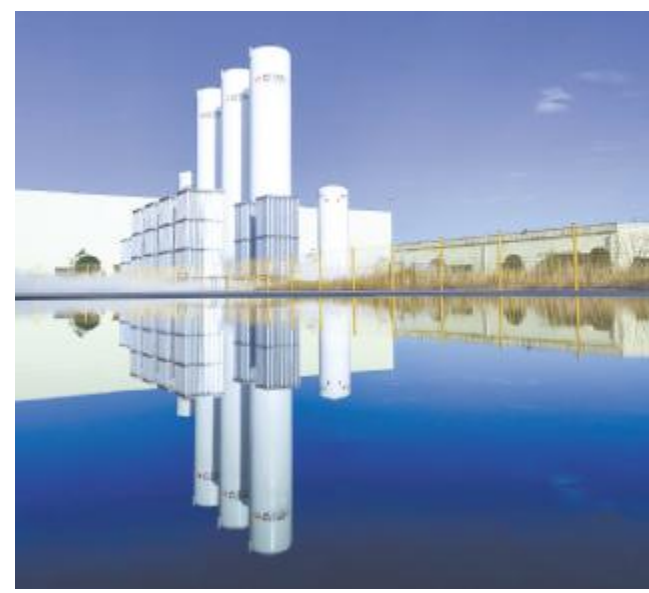
通威太阳能绿色厂区

以点滴节能环保行动,汇聚起推动绿色发展的磅礴动能。通威太阳能通过系列环保活动的开展,强化员工环保意识,认识到环保之于我们的重要性,了解了日常践行低碳生活的方式,同时以员工链接家庭和社会,宣传低碳生活理念,形成共创绿色未来的良好氛围。