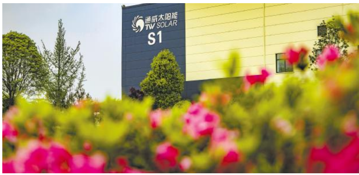
通威太阳能花园式厂区

通威太阳能致力于打造光伏电池绿色供应链,通过升级智能制造,提高生产效率,降低能源消耗。通过实施绿色供应商管理,加强供应链信息沟通和共享等多个举措,号召产业链所有供应商节约能源资源、保护环境,推动光伏行业经济效益、环境效益和社会效益的协调发展,为改善环境绩效,实现绿色发展而努力!