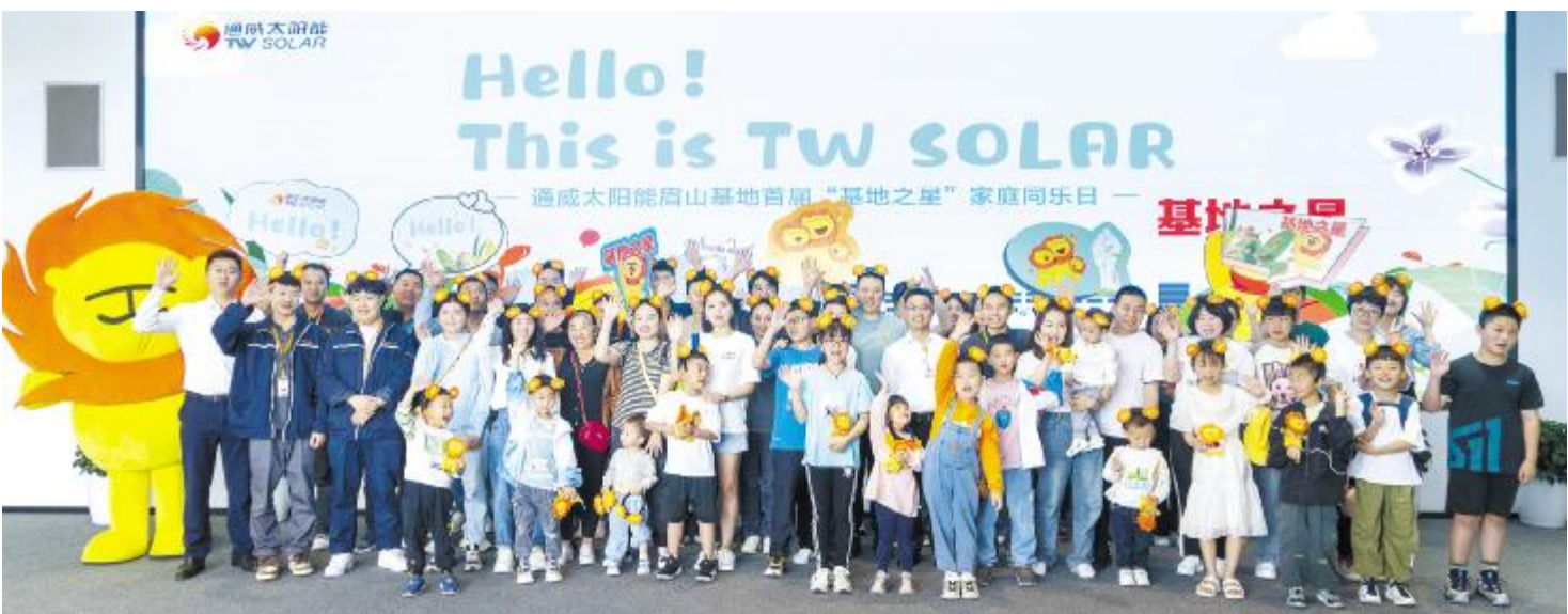
通威太阳能眉山基地首届“基地之星”家庭同乐日合影留念