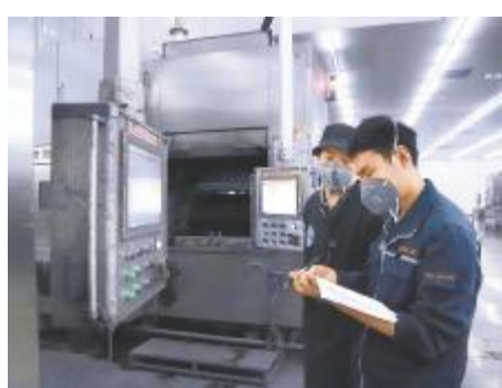
切片机换产时间技能竞赛