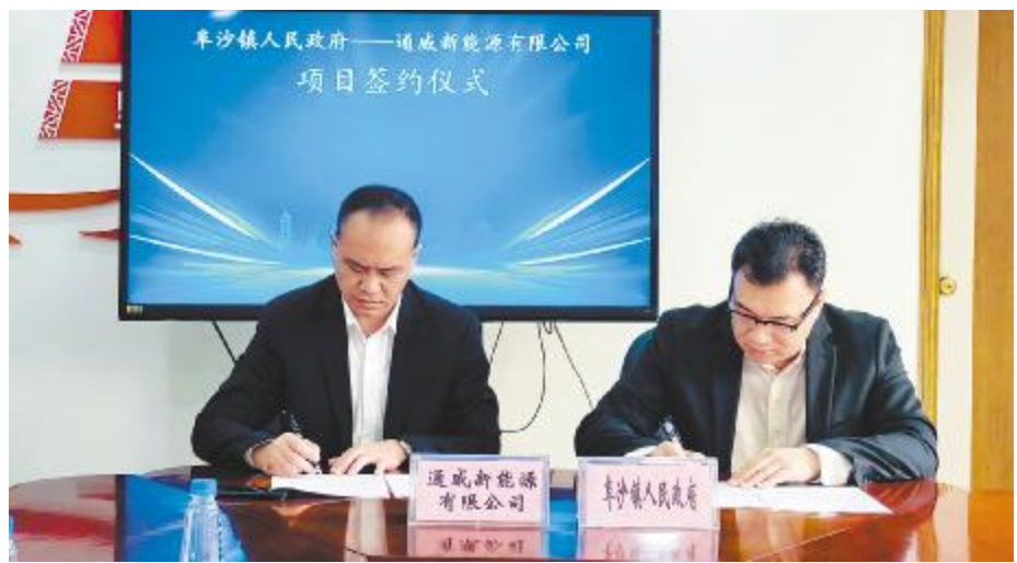
中山市阜沙镇和通威新能源签订合作协议