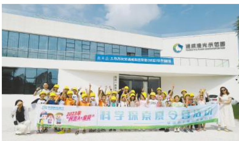
民生银行成都分行“科学探索”夏令营活动走进通威渔光示范园