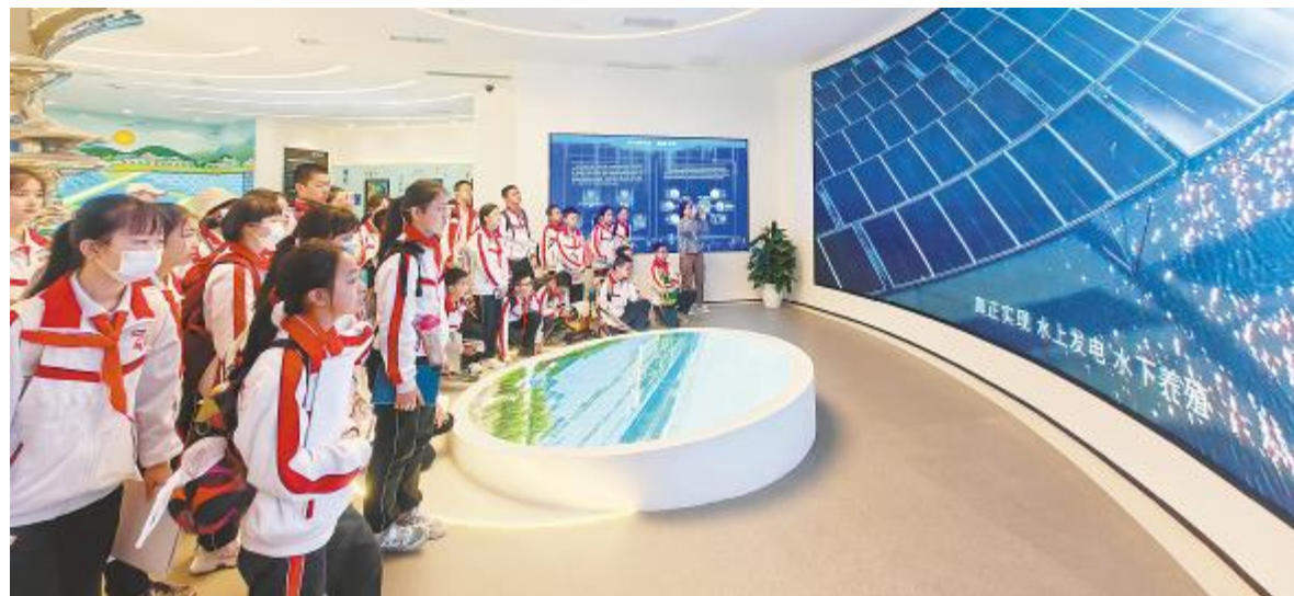
研学团了解通威“渔光一体”

此次交流是金风与通威新能源的首次交流，实现了双方的深入了解，将有助于建立供应商沟通渠道，为未来推进四川基地绿电供应开发工作打下基础，并致力于开发更优质的绿色能源解决方案。