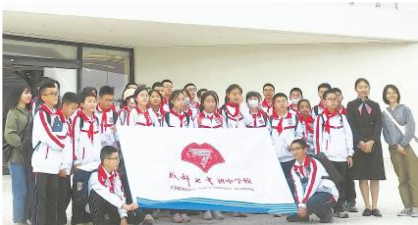
成都七中研学团参观通威渔光示范园