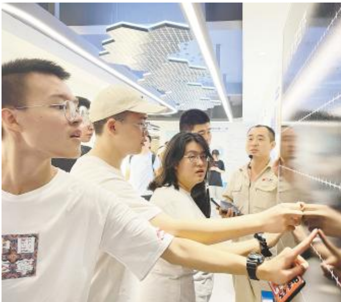
近距离了解光伏组件