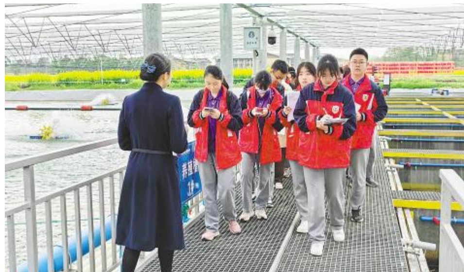
成都实验外国语学校研学之旅走进通威渔光示范园