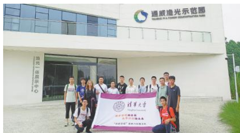
清华大学“清梁洁蜀”赴四川实践支队参观通威渔光示范园