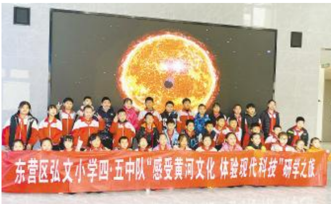
东营区弘文小学四·五中队研学之旅走进通威东营“渔光一体”生态园