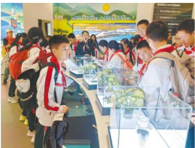
参观了解更多课外知识