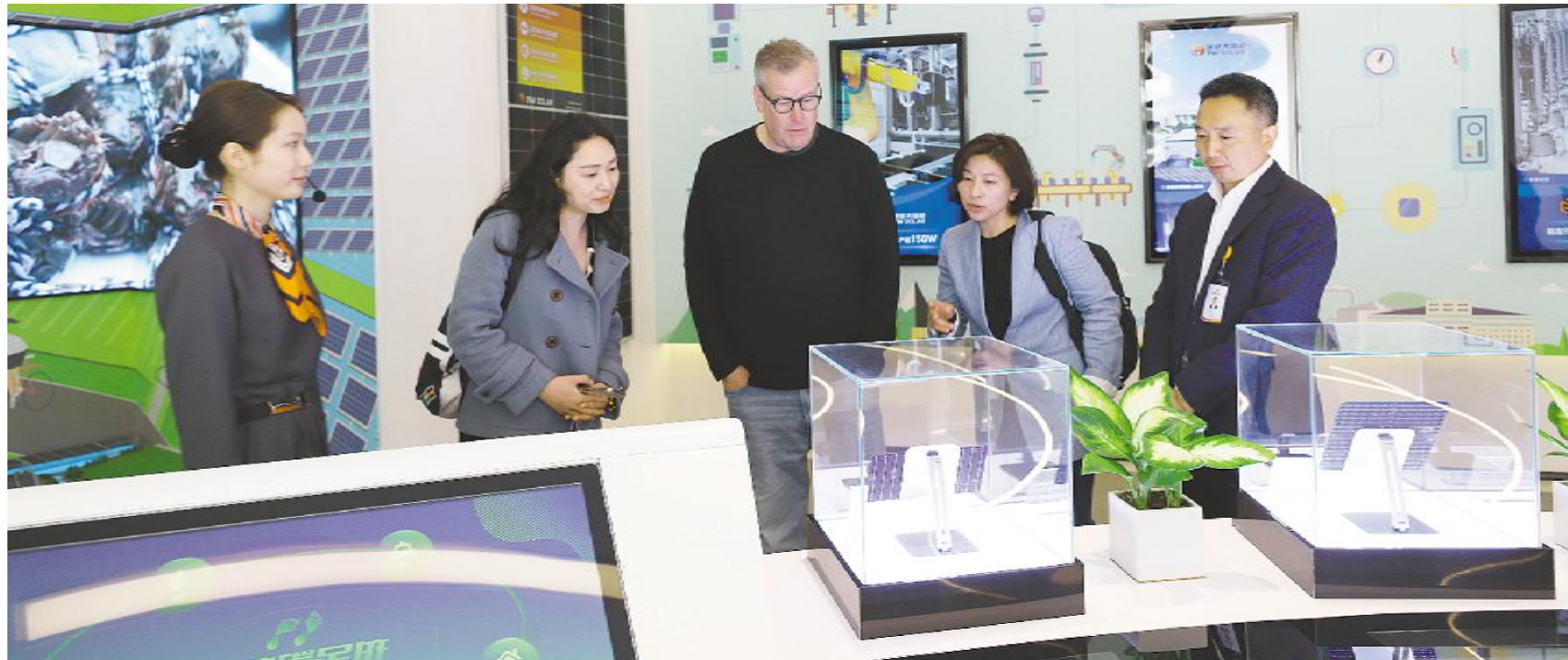
中央广播电视总台 CGTN《机遇中国·一线经济观察报道》栏目组参观通威渔光示范园