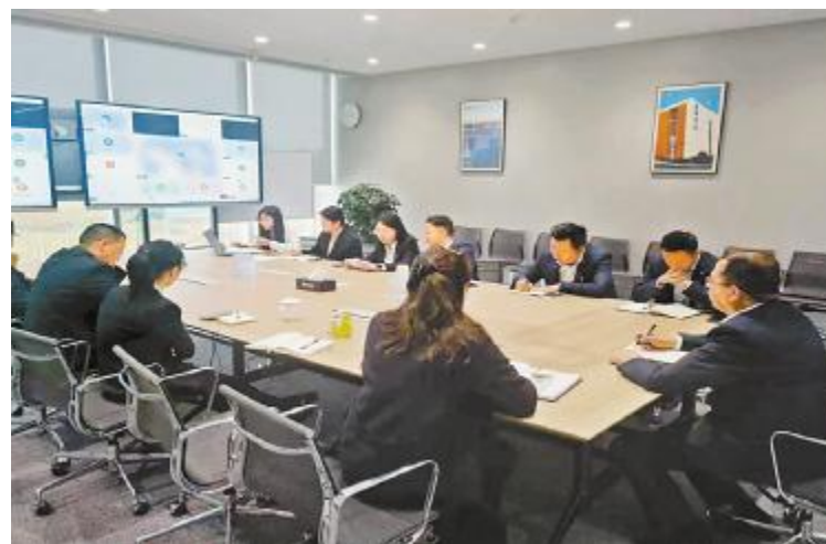
通威新能源深圳公司举办首届职工代表大会

工运动会,在管理平台品牌组的统一协调下,做好各公司选拔层面的活动筹备和执行工作,品牌组制定参赛选手的激励制度;涉及到优秀园区、标杆公司评选活动,从管理平台到各分子公司须做好自身6S管理,并且在管理日常中,持续开展企业文化宣贯,深入推进企业文化常态建设,争取获得突破性的成绩。