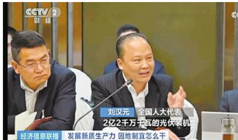
全国人大代表、全国工商联副主席、通威集团董事局刘汉元主席发言

在推进“双碳”目标背景下，作为国家重点支持的战略性新兴产业和推动能源转型的主力军，光伏产业近年来一直呈现快速发展态势，产业规模不断扩大，装机规模逐年大幅提升。为推动光伏产业高质量发展，促进我国能源转型，今年全国两会，全国人大代表、全国工商联副主席、通威集团董事局刘汉元主席针对促进光伏电站开发健康有序，助力我国“双碳”目标落地提出相关建议。