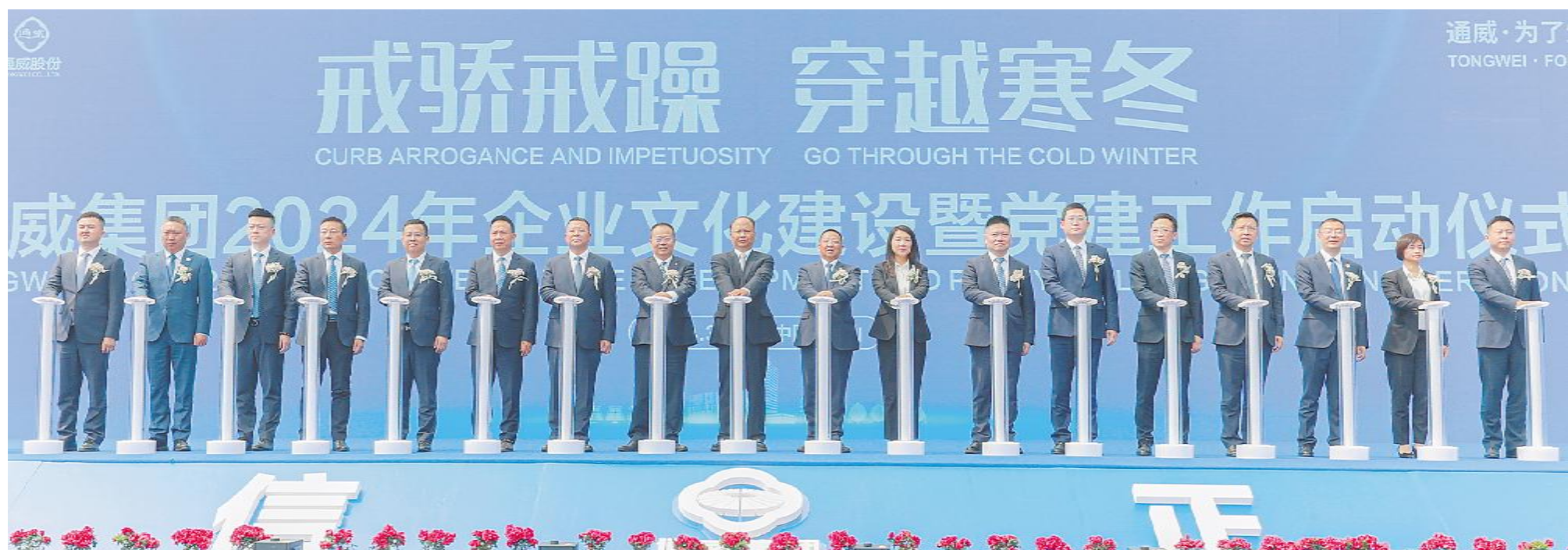
通威集团 2024 年企业文化建设暨党建工作启动仪式现场