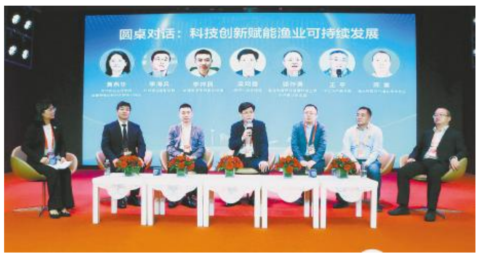
渔光物联参加第八届中国国际水产科技大会平行论坛圆桌对话