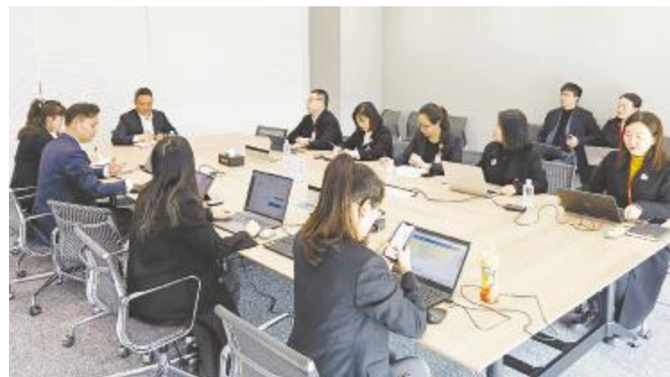
通威新能源举行企业文化专题会议

刘汉元主席表示,春夏秋冬自有轮回,市场总是有起有伏,只要心定神定,把握好每一件事情,做好每一项工作,所有通威人、行业同仁一定能够从从容容地跨过严冬,迎来阳光明媚的春天。我们相信阳光过去、现在和未来都会改变世界,在这个过程中,通威人会书写浓墨重彩的一笔,历史会感谢大家,历史也会记住大家。