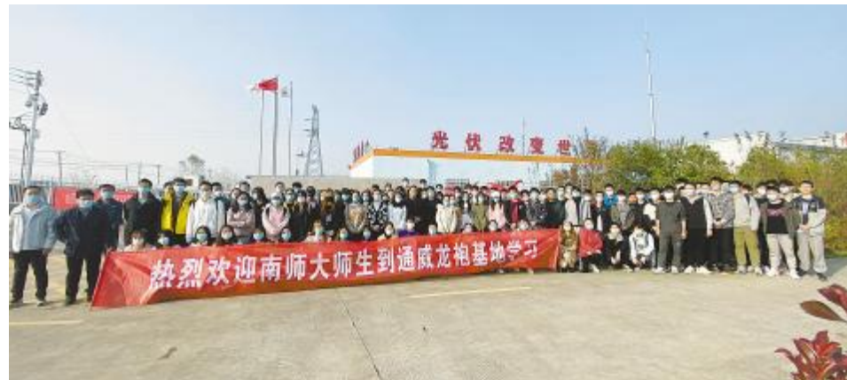
南京师范大学师生参观通威龙袍“渔光一体”基地