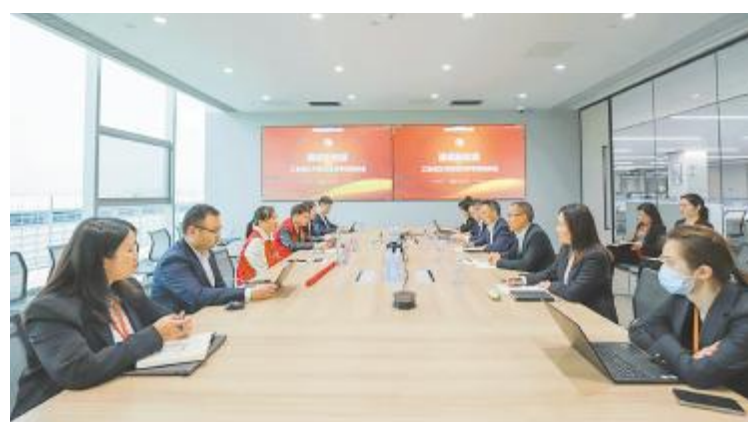
通威新能源开展工会普法专项培训

通过学习交流,参训人员更好地了解工会的相关知识,同时,也认识到工会在合法用工、权益维护、争议调解等方面的重要性。