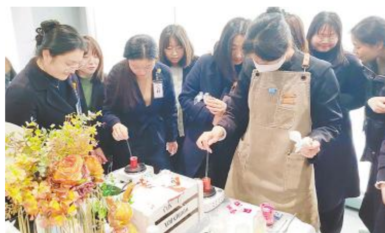
通威新能源三八妇女节活动现场

新员工表示,通过此次培训,更加深刻地感受到了通威文化理念,要积极投身工作当中,取得自身和企业的共同发展。