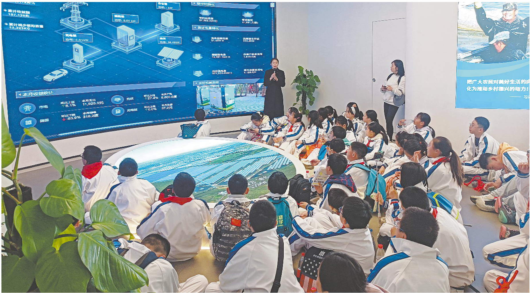
聆听科普知识讲解