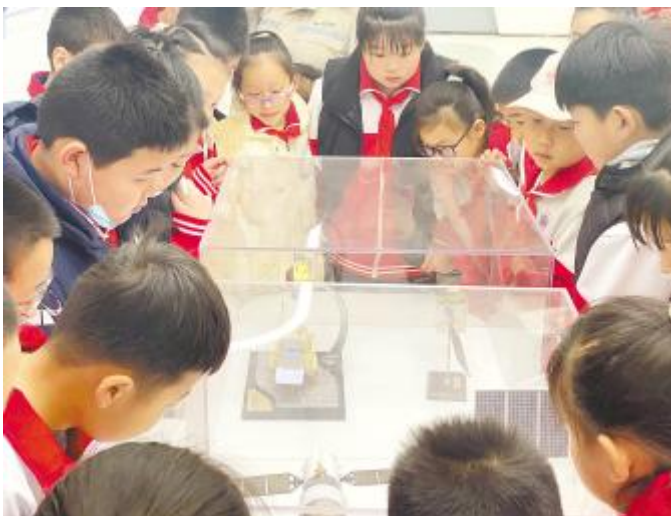
现场观察,触摸光伏