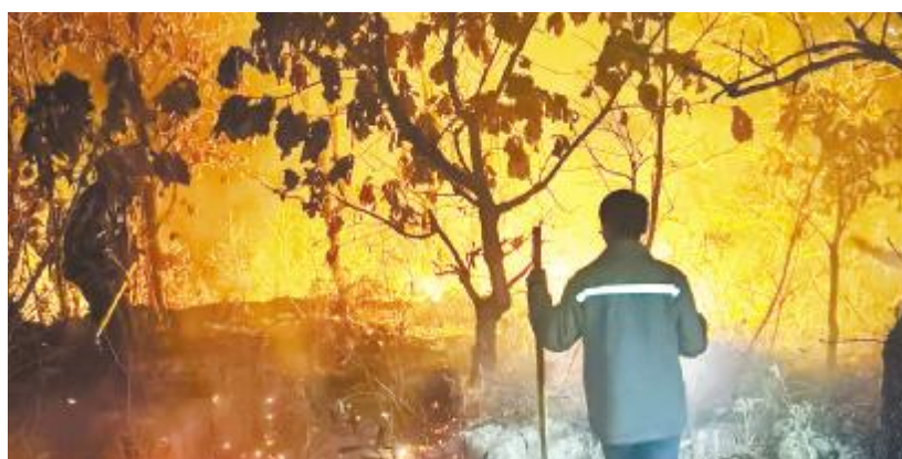
普安小坪地电站运维团队配合当地扑灭山火

贵州普安小坪地电站运维团队,是通威企业文化的践行者,更是全体员工榜样。渔光物联将继续筑牢安全防线,进一步强化应急管理及安全生产培训教育工作,不断提高员工应对突发事件的能力。